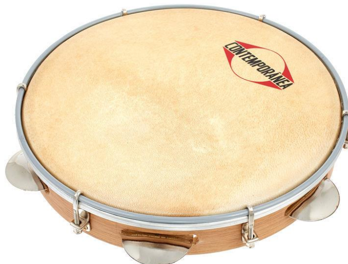
Figura 1- Pandeiro

Na figura 1 abaixo encontra uma imagem de um pandeiro. Idealmente, para esta actividade, poderíamos usar guizos, para simular o som metálico dos pratos do pandeiro. Uma vez que estamos confinados optei por materiais que poderás arranjar facilmente, ou que possas ter em casa. Assim, o nosso instrumento será uma espécie de tambor, com som de maraca, e que se parece com um pandeiro. Será um instrumento novo; o NOSSO instrumento. Boa?