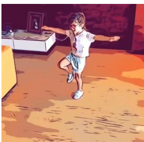
4. Ficar em equilíbrio num só pé