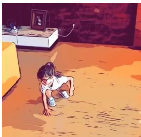
1. Tocar com 1 mão no chão

“Jogo das Estatuas”: Já conheces este jogo certamente, podes utilizar as tuas músicas favoritas e assim que deixes de ouvir deves realizar uma das imagens em baixo apresentadas, podes também pedir a colaboração de um adulto, quando o adulto bater palmas deves parar e realizar também uma das imagens ou outras à tua escolha.