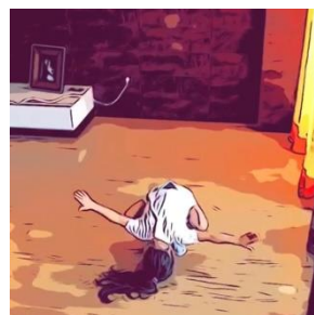
5. Tocar com a cabeça no chão