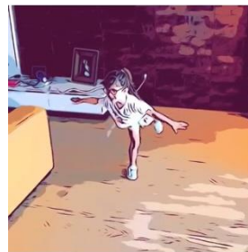
2. Realizar o avião