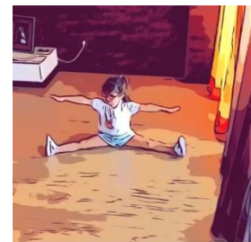
3. Realizar a espargata